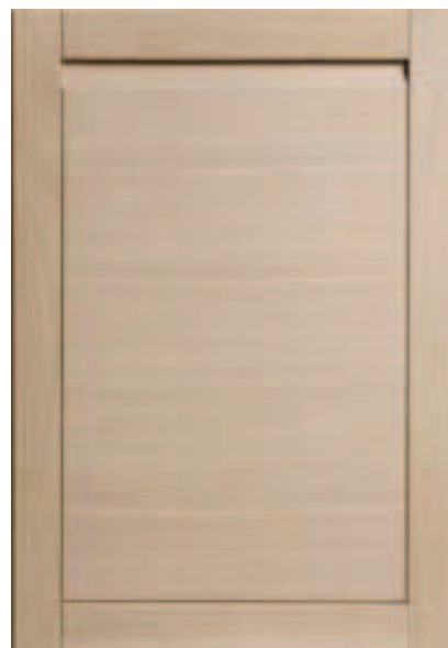
Fronty nowoczesne – od lewej Warszawa, Bruksela, Londyn.